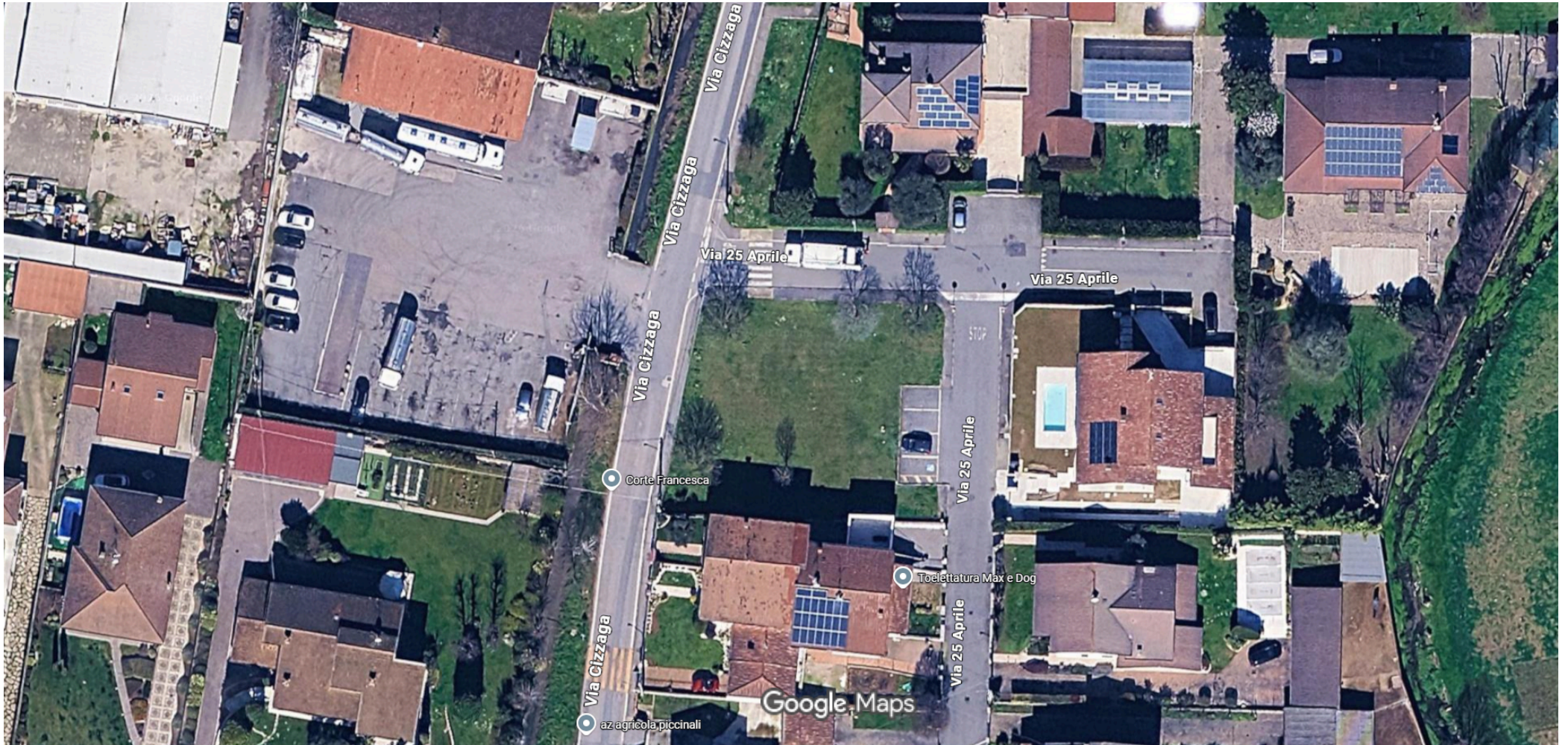
10 m